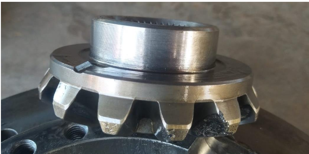
(Engrenagem do Sistema diferencial)