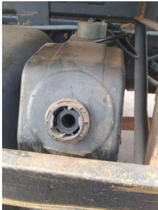
(Tanque de armazenamento de ARLA)