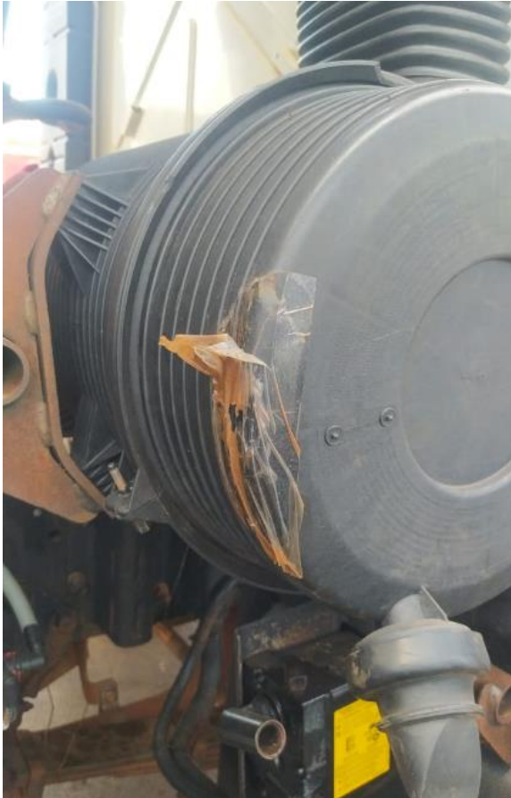
(Caixa do filtro do ar)