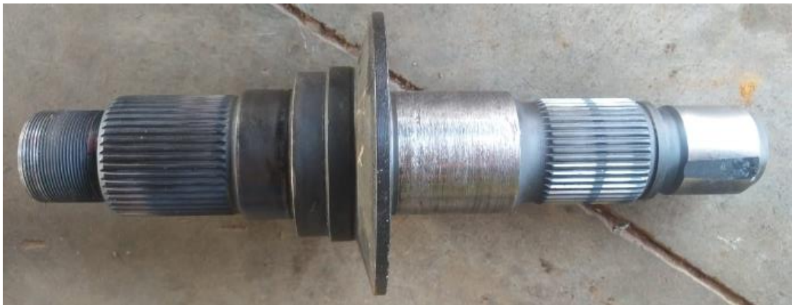
(Eixo do diferencial)