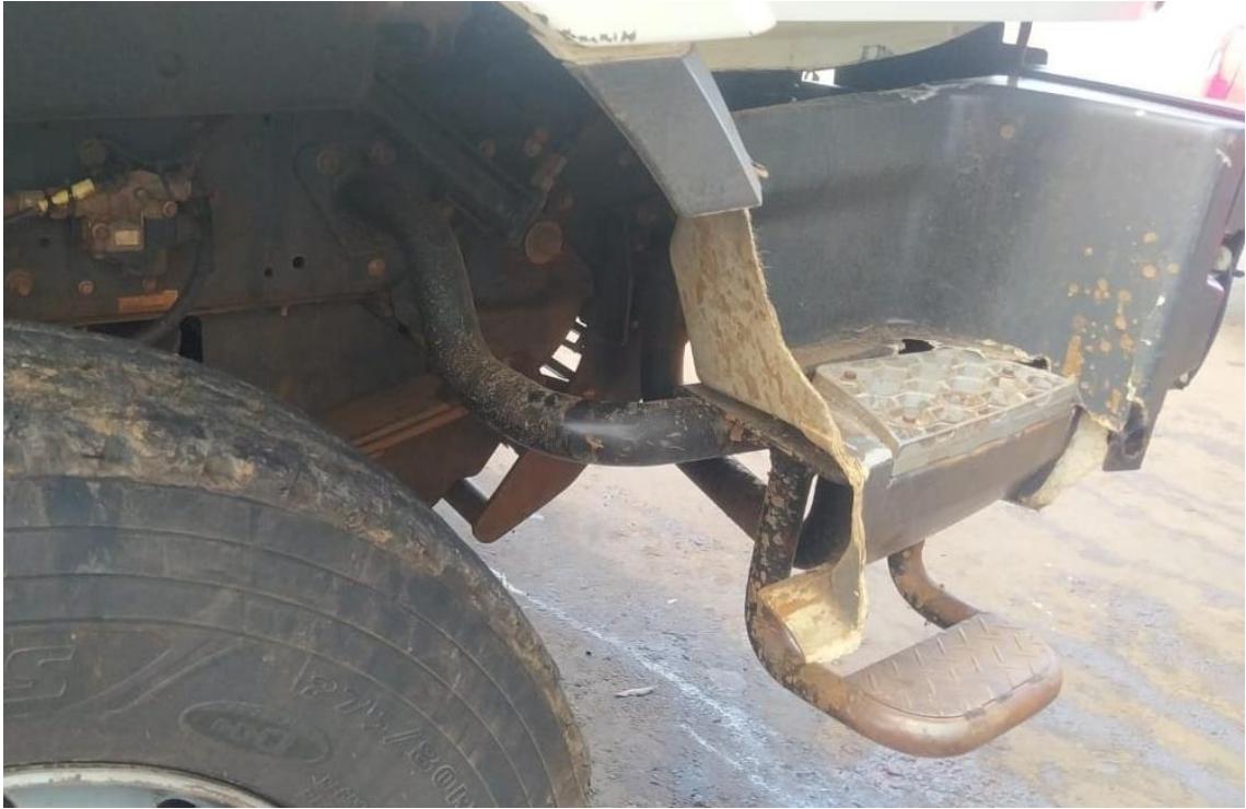
(Estribos e parte do para-choques dianteiro)